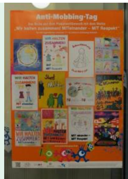
Die Gewinner-Motive des Aktionstages 2015

Soziale Netzwerke werden immer beliebter