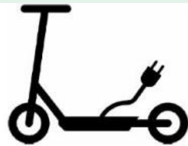
Piktogramm für Elektrokraftfahrzeuge in §39

Für Wohnmobile und Elektrokraftfahrzeuge im Sinne der Elektrokraftfahrzeug-Verordnung (eKFV) wurden Piktogramme in § 39 eingeführt, um diese Fahrzeugarten mit besonderer Zweckbestimmung künftig zum Gegenstand von Zusatzzeichen machen zu können (z. B. zur Kennzeichnung entsprechender Parkflächen), sowie zur entsprechenden Ergänzung der Anlage 2 zu § 41 Absatz 1 StVO. Ein neues Verkehrszeichen verbietet für mehrspurige Fahrzeuge und Krafträder mit Beiwagen das Überholen von einspurigen Fahrzeugen.