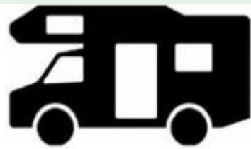
Piktogramm für Wohnmobile in §39

Mit einem entsprechenden Zeichen für Personenkraftwagen oder Krafträder mit Beiwagen, die mit mindestens drei Personen besetzt sind, wurde die Möglichkeit geschaffen, bei Verzicht auf Parkgebühren dies auf dem Parkscheinautomaten auch außerhalb von Parkraumbewirtschaftungszonen darstellen zu können.