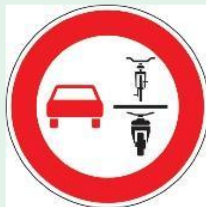
Wer ein mehrspuriges Kraftfahrzeug führt, darf ein- und mehrspurige Fahrzeuge nicht überholen.

Ferner wurde klargestellt, dass Akustische Fahrzeugwarnsysteme im Sinne der Verordnung (EU) Nr. 540/2014 des Europäischen Parlaments und des Rates vom 16. April 2014 (ABl. L 158 vom 27. Mai 2014, S. 131) keine Schallzeichen im Sinne des § 16 Absatz 1 und 3 StVO sind.