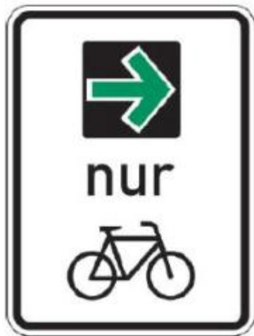
Durch dieses Zeichen wird der Grünpfeil auf den Radverkehr beschränkt.

Für Fahrräder zum Transport von Gütern oder Personen, Lastenfahrräder ist sogar ein eigenes Sinnbild eingeführt worden.