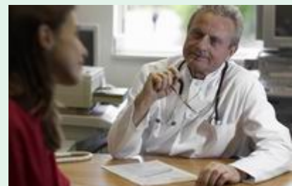
Bei einer Burn-out-Erkrankung sollte sich der Betroffene ärztliche Hilfe suchen